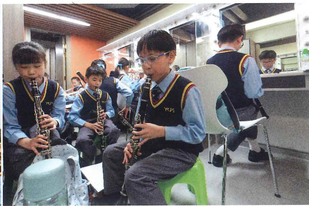
學生出場前不忘練習。