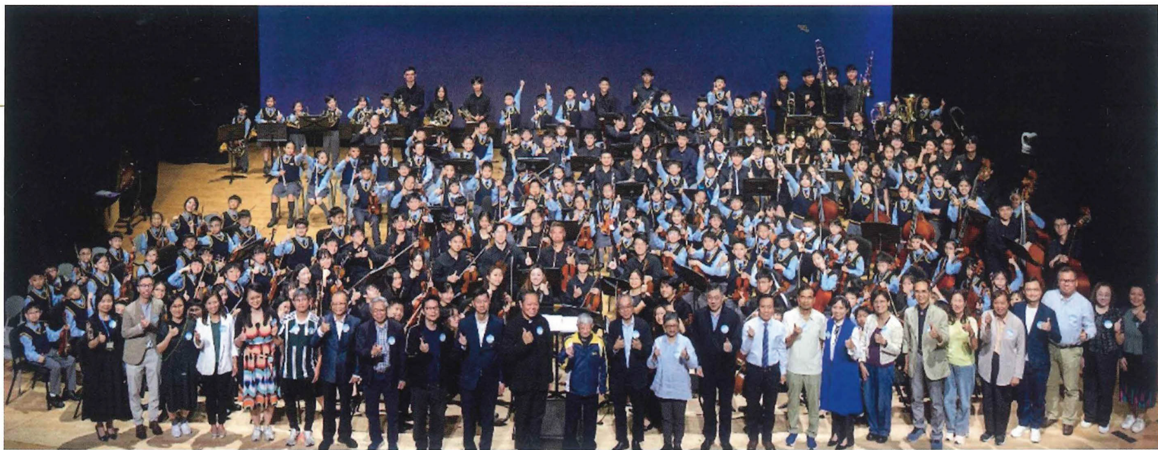
音樂會圓滿結束，一眾嘉賓與演出者合照。