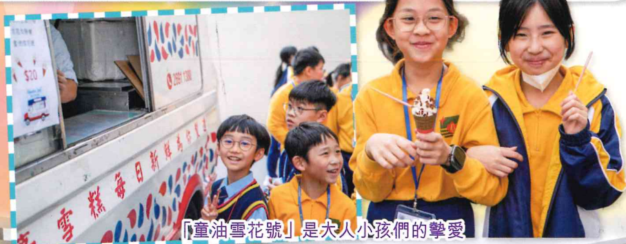
「童油雪花號」是大人小孩們的摯愛