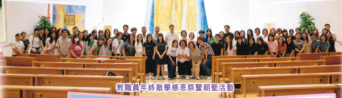
教職員年終散學感恩祭暨朝聖活動