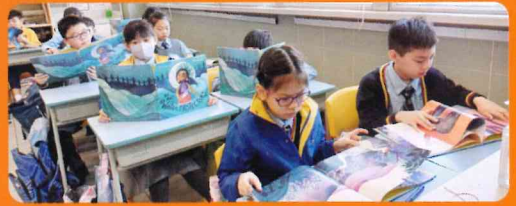
跨課程閱讀計劃是配合中、英文科的繪本閱讀，一方面提升學生對水資源的認識及保護地球上珍貴資源的重要性，同時藉着各科引入的文本閱讀，強化各科的科本學習。