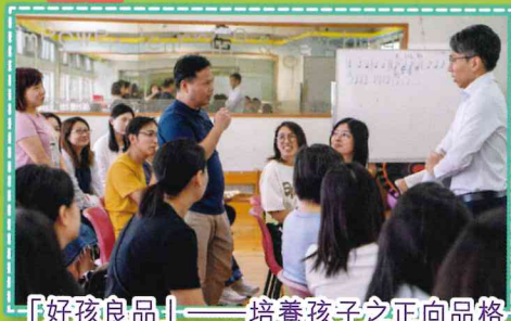
「好孩良品」——培養孩子之正向品格 家長講座