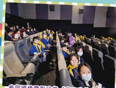
參與國情電影欣賞《我和我的父輩》