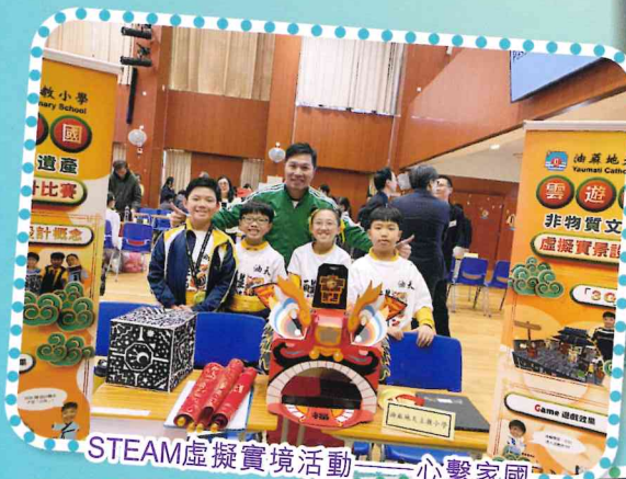
STEM虛擬實境活動 心繫家國