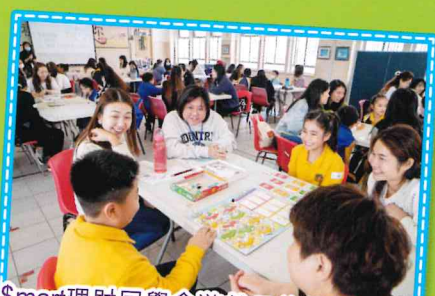
e$mart理財同學會遊戲日後傳親子活動

本校於2025年共舉辦了9項家長教育及親子活動，透過多元化的講座與體驗活動，協助家長以正向方式與子女溝通，促進家庭和諧與親子關係，並共同享受珍貴的親子時光。我們深信家長教育是孩子全面發展的重要基石，本校將繼續舉辦不同類型的家長教育及親子活動，期望家長繼續與學校攜手合作，為孩子營造一個充滿愛與支持的成長環境，讓他們茁壯成長。