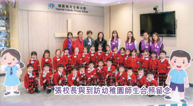
張校長與到訪幼稚園師生合照留念