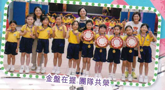
金盤在握 團隊共榮