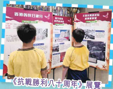
《抗戰勝利八十周年》展覽

來年我們希望繼續能為學生提供更多學習歷程，讓國家觀念、文化情感與公民素養能夠在日常中自然累積。