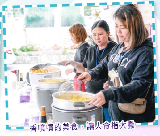
香噴噴的美食，讓人食指大動