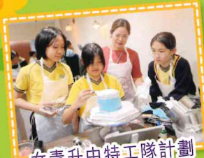
女青升中特工隊計劃 親子活動