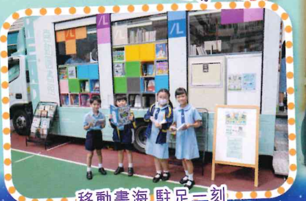
移動書海 駐足一刻