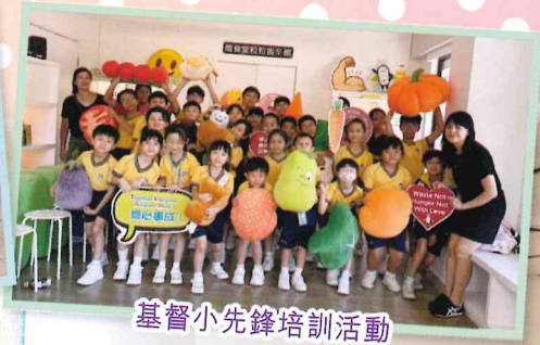
基督小先鋒培訓活動