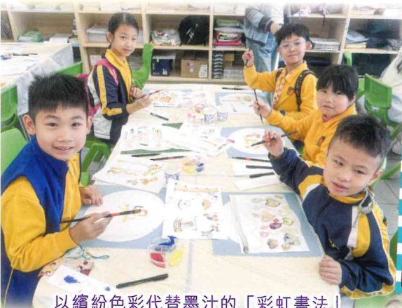
以繽紛色彩代替墨汁的「彩虹書法」