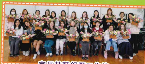
家長花藝舒壓工作坊