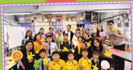
親子氣球創作工作坊暨童油樂 義賣活動