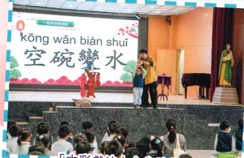
「古彩戲法」之空碗變水

「童·油樂」活動如同一座橋樑，將悠久的傳統以生動、可親的方式帶到新一代面前。孩子們在玩樂中啟蒙，在體驗中扎根，親身感受中華文化並非陳列於書架，而是能觸碰、能創造、能奔跑躍動的活潑生命。這份由童心點燃的文化薪火，必將持續閃耀，代代相傳。