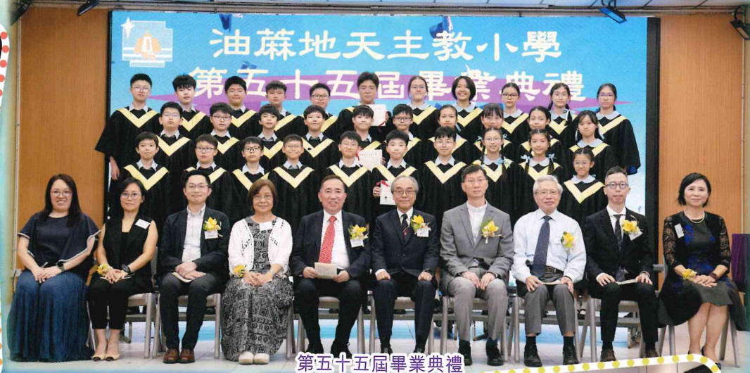
第五十五屆畢業典禮