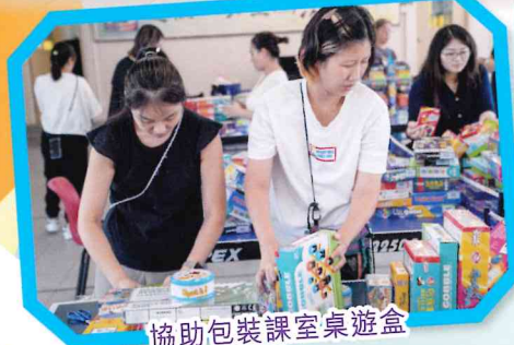
協助包裝課室桌遊盒