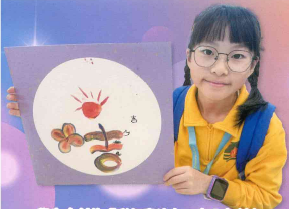
學生自創的「彩虹書法」，十分有創意！