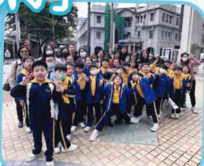
走近油蔴地的歷史建築， 探討保育的重要性

「科科油滿FUN」其課程設計均以學生為本，緊扣時代脈搏。藉着推動跨課程整合（如STEM、跨課程閱讀），讓知識不再是孤立的點，而是能融會貫通的網絡，培養學生綜合應用能力。