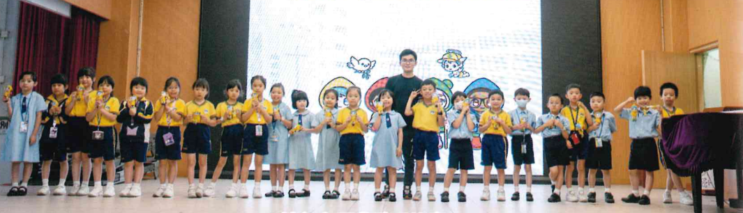
禧年主題曲歌唱比賽