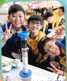
設計、製作及測 試濾水器

本校大力推動的STEM教育，突破學科界限，強調動手探究與解決問題。從編程、機械人設計到科學專題研習，學生在真實的挑戰中學習整合科學、科技、工程與數學知識，培養不可或缺的邏輯思維、創新能力及團隊協作精神。