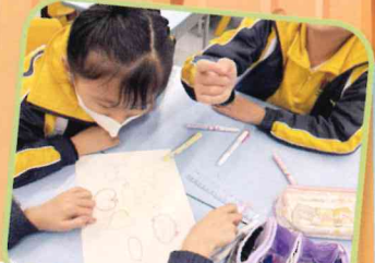
製作腦圖，深入探索水的循環