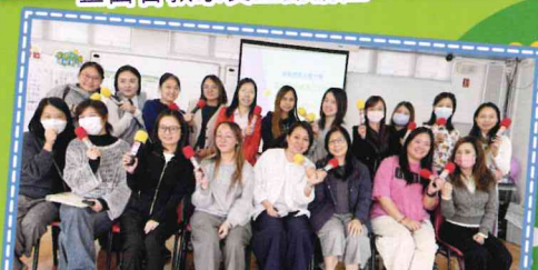
高小「正面管教」實戰家長工作坊