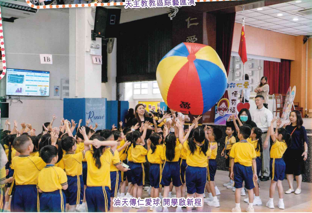
油天傳仁愛球 開學啟新程