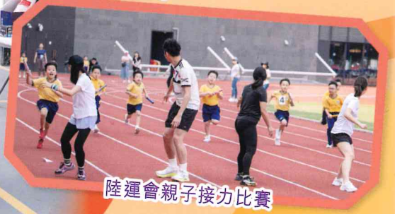
陸運會親子接力比賽