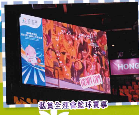
觀賞全運會籃球賽事