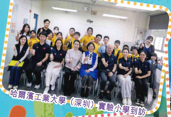
哈爾濱工業大學(深圳)實驗小學到訪