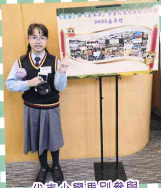
代表小學界別參與《憲基大使》嘉許禮