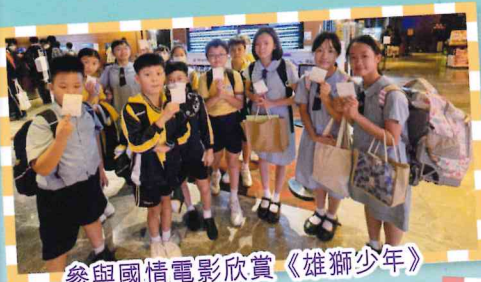
參與國情電影欣賞《雄獅少年》