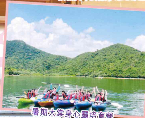
暑期大棠身心靈培育營