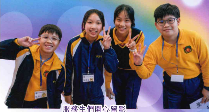
服務生們開心留影