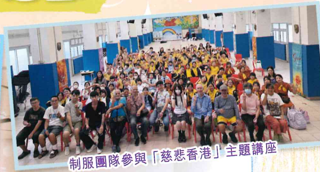
制服團隊參與「慈悲香港」主題講座