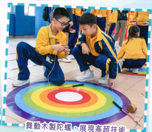
舞動木製陀螺，展現高超技術