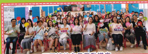
正面管教家長互動講座