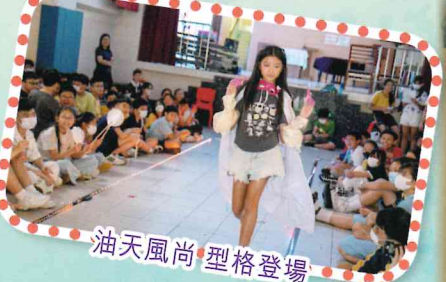
油天風尚 型格登場