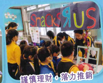
謹慎理財，落力推銷