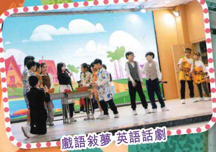
戲語敘夢 英語話劇