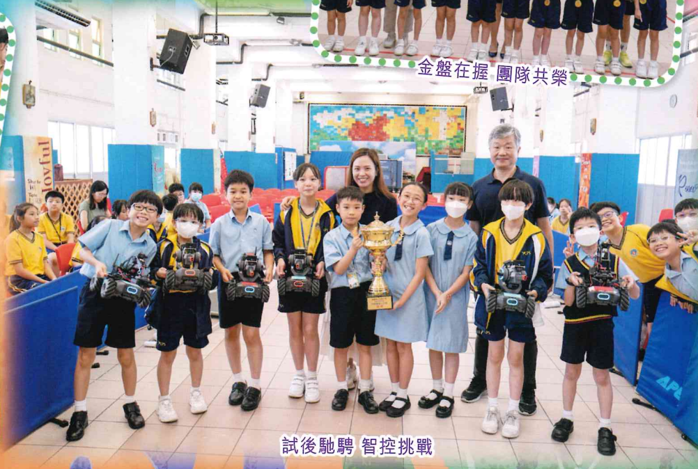
試後馳騁 智控挑戰