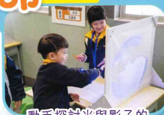
動手探討光與影子的 關係