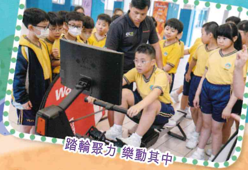
踏輪聚力 樂動其中