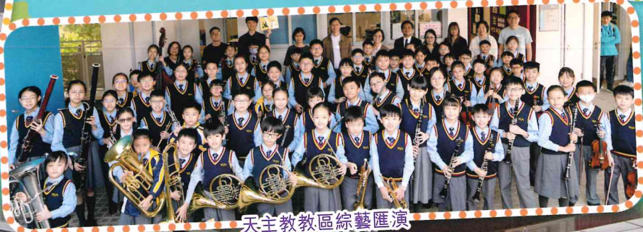
天主教教區綜藝匯演