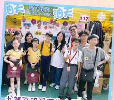
九龍區明愛賣物會攤位遊戲