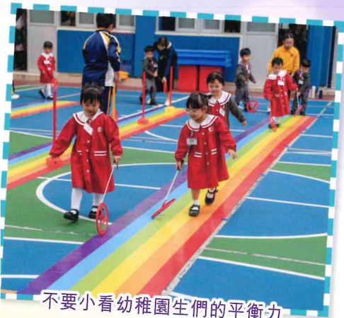
不要小看幼稚園生們的平衡力