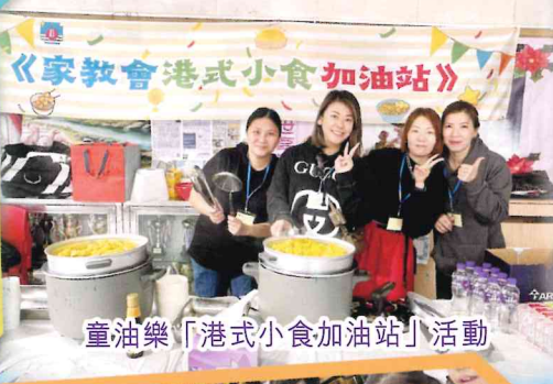
童油樂「港式小食加油站」活動