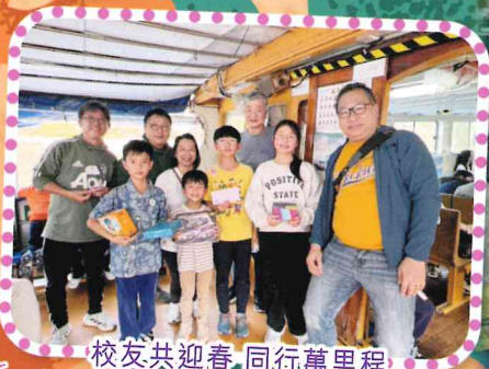
校友共迎春 同行萬里程