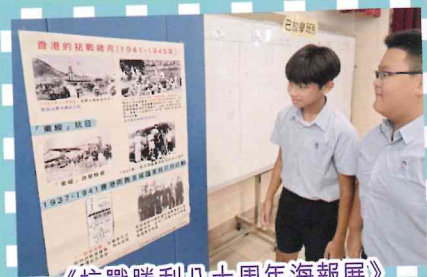
《抗戰勝利八十周年海報展》