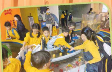
參觀《水知園》，加強對水資源 及節約用水的認識

跨課程閱讀計劃將閱讀有機地融入各學科。由三年級《油蔴地深度遊》到四年級《生命之源》，讓學生透過多元文本，不僅深化學科知識，更學會批判思考、整合資訊，從而建構穩固的自主學習能力，為終身學習打下堅實基礎。