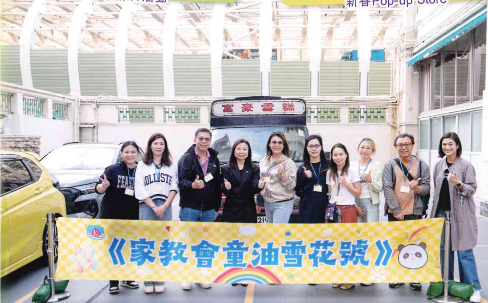
童油樂雪糕義賣活動