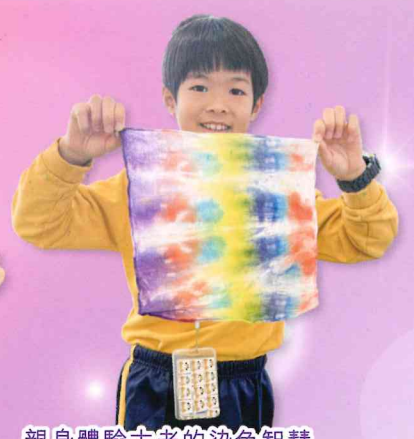
親身體驗古老的染色智慧