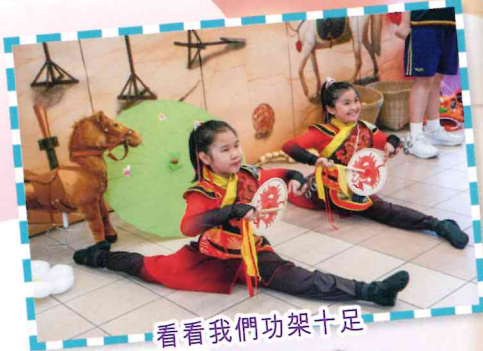
看看我們功架十足