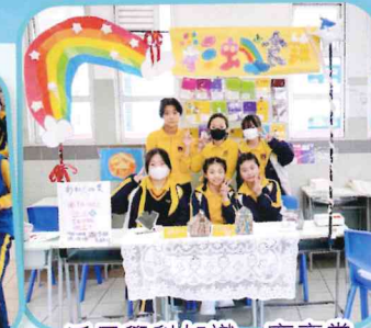
活用學科知識，齊齊當 「老關」