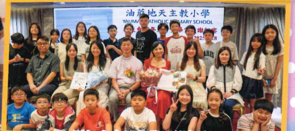
周年大會暨畢業生謝師宴