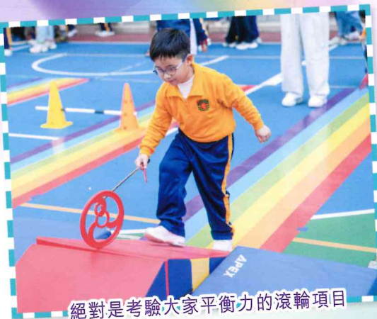
絕對是考驗大家平衡力的滾輪項目