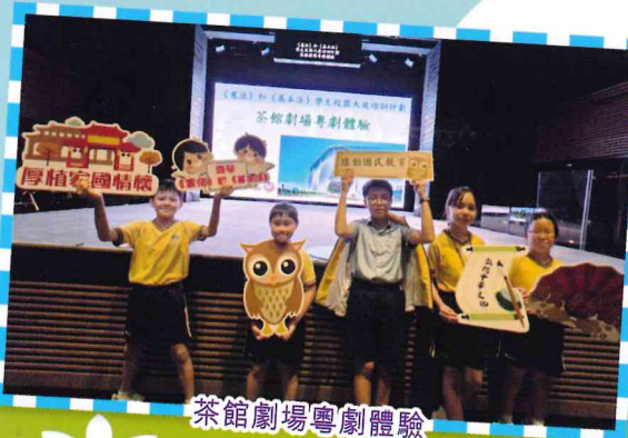
茶館劇場粵劇體驗