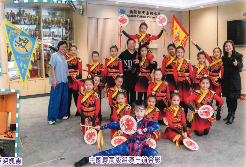
中國舞高級組演出前合影