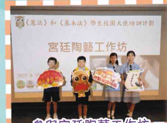
參與宮廷陶藝工作坊