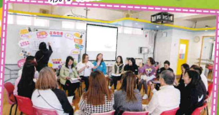
聯校「正面管教」實戰家長工作坊