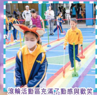
滾輪活動區充滿了動感與歡笑