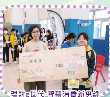
理財e世代 智慧消費新思維