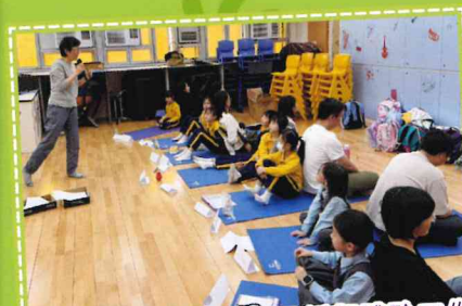
「我們的330故事」親子靜觀體驗工作坊