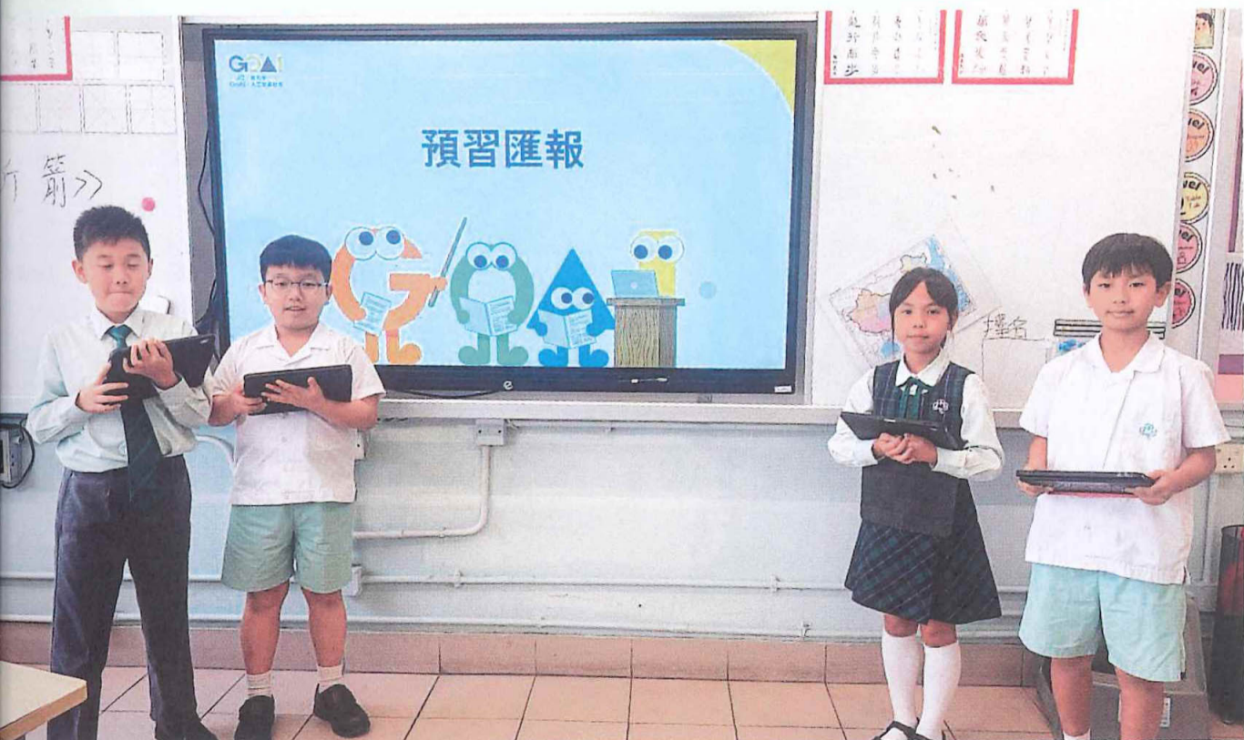
參與計劃的學校學生透過 AI 生成匯報文稿。