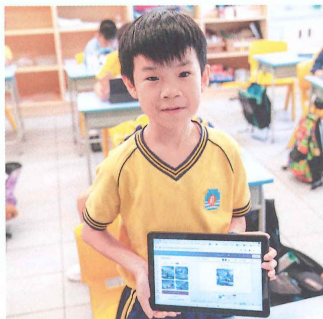
參與計劃的學校學生利用 AI 生成故事繪本。